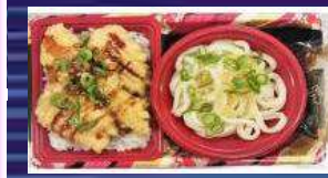
とり天井とうどんセット